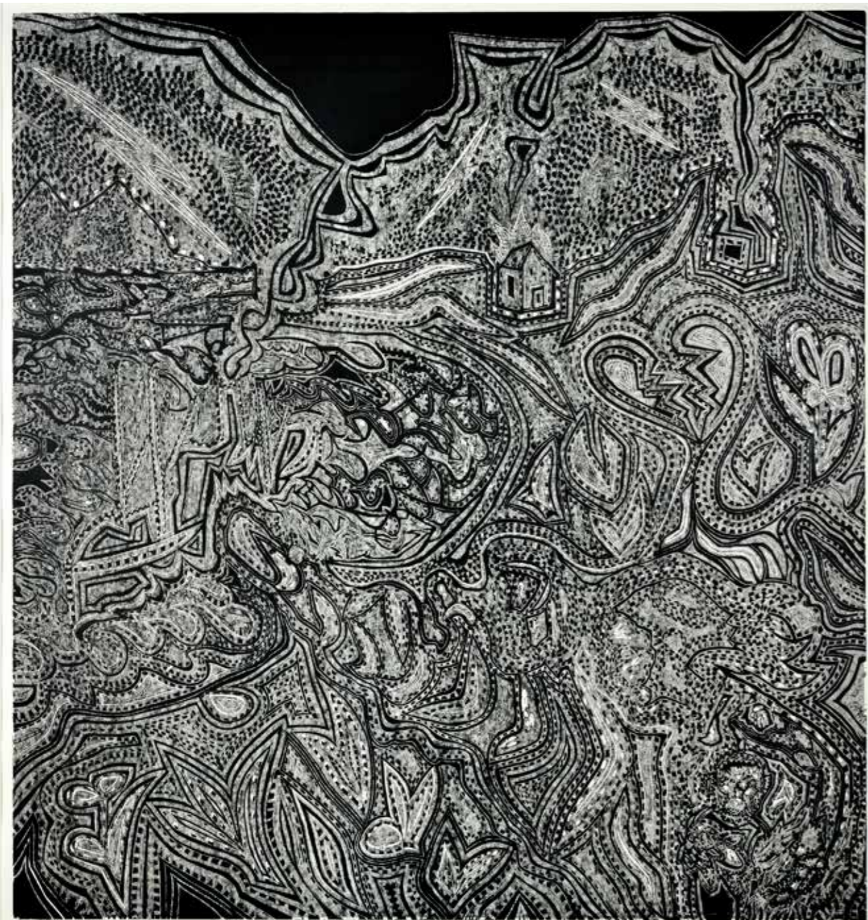
Arnold Johansen: Avskjed – svart, 2000