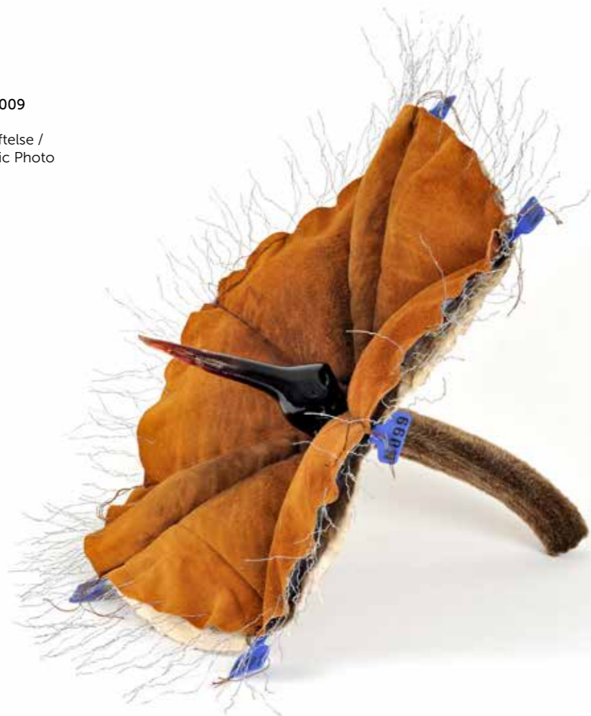
Aslaug M. Juliussen: Re: Frozen Flowers, 2009