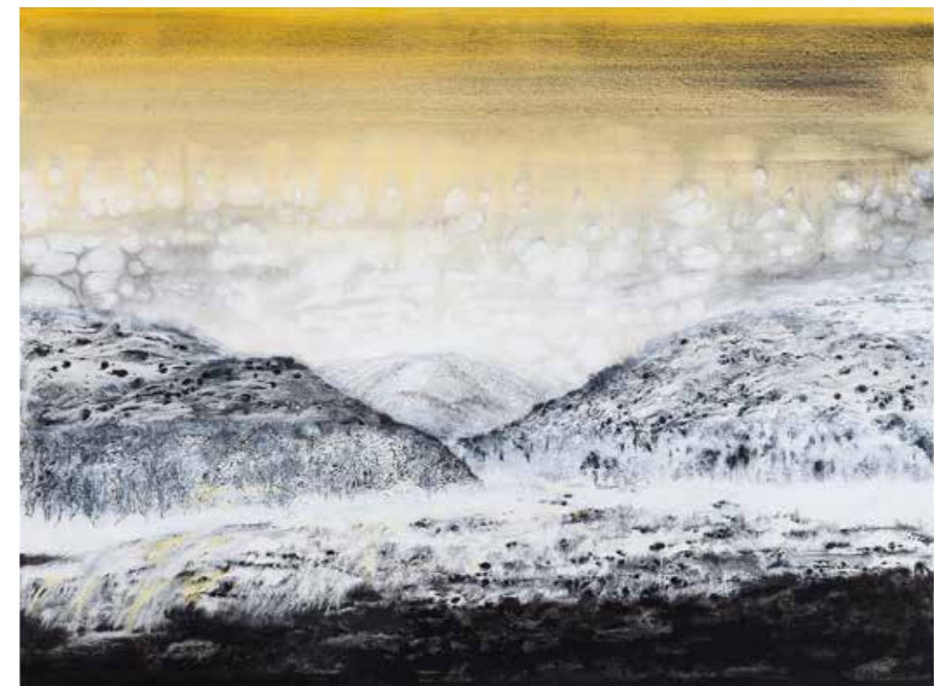
Outi Pieski: Gárdečohka, 2014

Outi Pieski is a Finnish-Sámi artist whose art studies include training in painting at the Academy of Fine Arts in Helsinki. She has gone on to work with a number of other art forms such as installation, textiles and sculpture. Pieski represents the new generation of artists who draw inspiration from their Sámi roots and employ new idioms and juxtapositions. Her work, Rajankäynti I , portrays a frozen Arctic landscape with fragments of fabric in colours reminiscent of traditional Sámi textiles and costumes. Pieski's works are represented in collections such as KORO – Public Art Norway; RiddoDuottarMuseat, Karasjok; the Sámi Parliament, Karasjok; EMMA – Espoo Museum of Modern Art, Espoo and Ateneum – the National Museum of Finland, Helsinki. Outi Pieski is one of five members in the Miracle Workers Collective , a group of artists participating at the 58th Venice Biennale, Biennale Arte 2019.