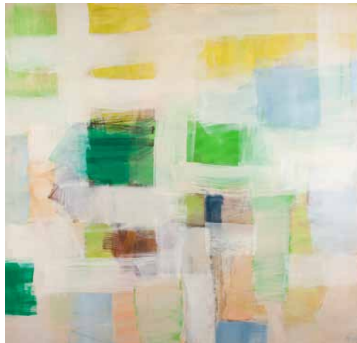
Synnøve Persen, Labyrinth II (2006–2009)