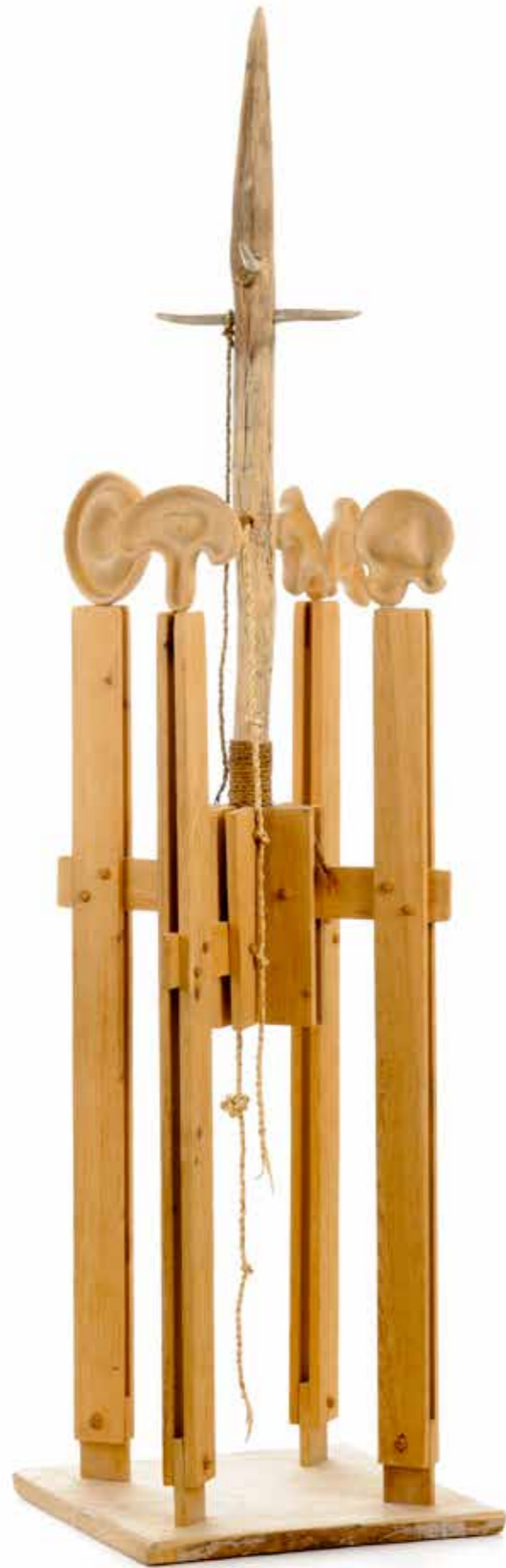
Iver Jåks, Offerstøttene I, 1980